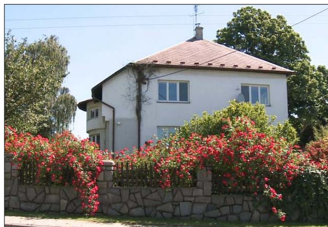
Obec Hlavnice vyhrála v Moravskoslezském kraji i svoji upravenost

http://www.novinky.cz/cestovani/206692-soutez-vesnice-roku-2010-uz-zna-finalisty-ze-vsech-kraju.html