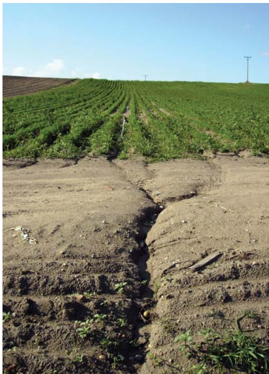
eroze půdy v porostu brambor na svažitém pozemku