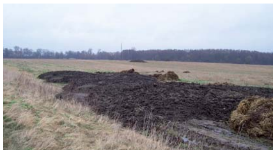
příklad nadměrné aplikace kalu