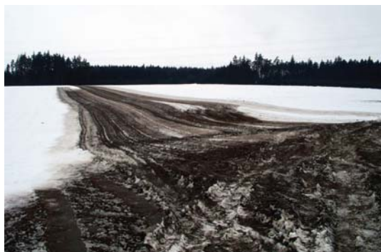
nesprávné hnojení na půdu pokrytou vrstvou sněhu

Splnění požadavku se zjišťuje kontrolou v terénu. Při podezření na porušení probíhá kontrola dat aplikace hnojiv dle evidence o hnojivech použitých na zemědělskou půdu, knihy jízd, popř. výkazů práce, s využitím záznamů nejbližších hydrometeorologických stanic.