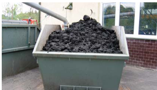
bezpečný transport kalu v kontejneru