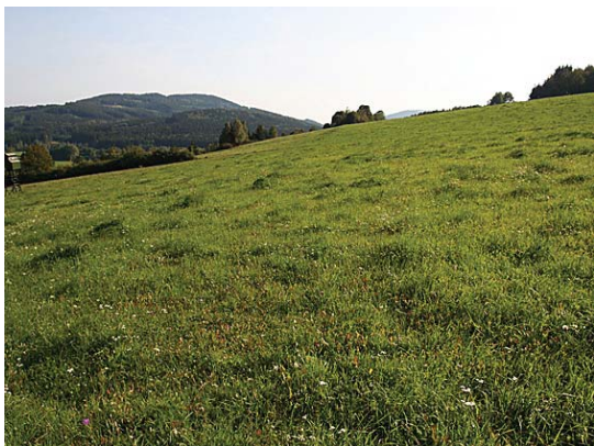
vhodné využití svažitého pozemku (stálá pastvina)