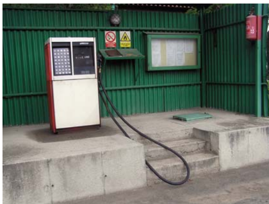
čerpací stanice pohonných hmot vhodně zabezpečená proti únikům ropných látek i vlivu srážkových vod

Manipulační plochy čerpací stanice pohonných hmot: Musí mít nepropustnou a dostatečně odolnou úpravu proti účinkům ropných látek a musí být zabezpečeny proti vlivu srážkových vod z okolí. Výhodným řešením je zastřešení manipulačních ploch, jinak musí být srážkové vody odvedeny do jímky a likvidovány přes čistící zařízení. Ideálním řešením skladů ropných látek jsou dvouplášťové nádrže s kontinuální indikací meziplášťového prostoru. Největší nebezpečí z hlediska ochrany vod představují podzemní, zevně nekontrolovatelné jednoplášťové nádrže s jejich potrubními rozvody.