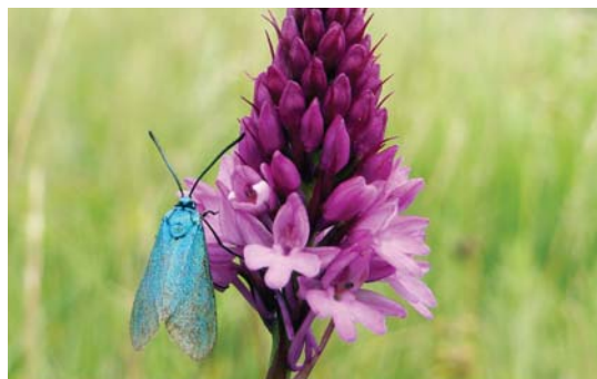
Chráněnými druhy na loukách v EVL mohou být například orchideje, jako je rudohlávek jehlancovitý.