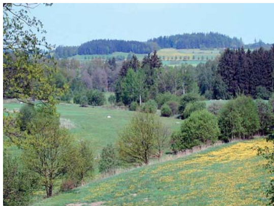
Vhodná mozaika krajinných prvků a způsobů hospodaření na zemědělských pozemcích ve svažitém terénu zajišťuje optimální ochranu půdy a vody.