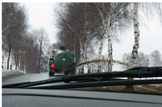
Náhodně zachycený snímek nevhodné aplikace močůvky nebo hnojivky.

při terénním šetření. Aplikace kejdy nebo močůvky může být zcela vyloučena na základě zvláštního právního předpisu. 4