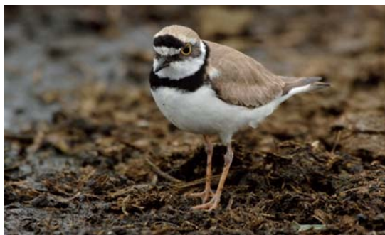
kulík říční, autor Tomáš Bělka