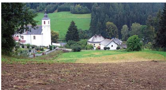
Rozorání svahu znamená riziko splavení půdy do vsi.

cí plodina už sklizena. Travní porost je evidován v LPIS buď jako travní porost – stálá pastvina 5 nebo jako ostatní travní porosty. Rozorání je považováno za závažnější, pokud je rozorána stálá pastvina, dále pokud k němu dojde na pozemcích se sklonitostí nad 7° nebo pozemek obsahuje hlavní půdní jednotky (HPJ, vyjádřené druhou a třetí číslicí kódu BPEJ) s vysokou vsakovací schopností. 6 Rozoraným pozemkem se rozumí skutečně rozoraná plocha na půdním bloku nebo jeho dílu.