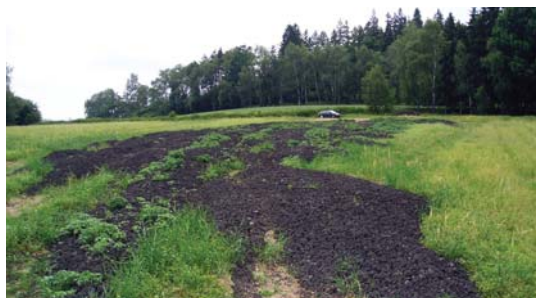
nadměrná dávka kalu (nedodržení maximální dávky sušiny na 1 ha)