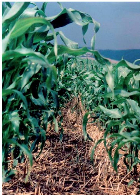
kukuřice pěstovaná půdoochrannou technologií (setá do mulče) na svahu