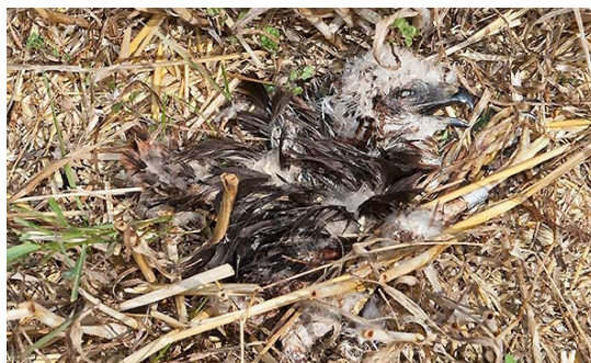
Mláďe motáka lužního usmrcené v důsledku nedodržení zákazu zemědělských prací v době hnízdění, autor K. Poprach.