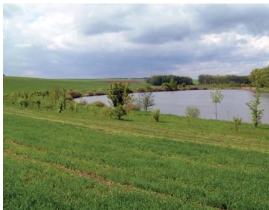
příklad ochranného pásu kolem břehu rybníka

Třímetrový ochranný pás se vztahuje pouze na zemědělské pozemky přímo přiléhající k útvaru povrchových vod (definice útvaru povrchových vod je uvedena výše u kontrolovaného požadavku SMR4/5). Zákaz hnojení v ochranném pásu se vztahuje pouze na aplikaci hnojiv, včetně hnojiv statkových.