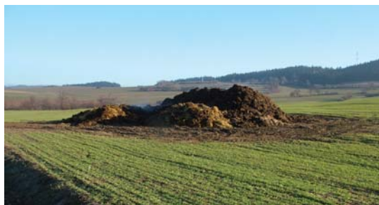
vhodně situované polní složiště hnoje

Místo vhodné k uložení tuhých statkových a organických hnojiv: Na orné půdě i travních porostech mohou být uložena jednotlivě nebo ve směsi tuhá statková hnojiva nebo kompost vyrobený pro vlastní účely ze statkových hnojiv. Složiště musí být situováno tak, aby se případný výtok tekutých složek nedostal do povrchových nebo podzemních vod a neohrozil jejich jakost.