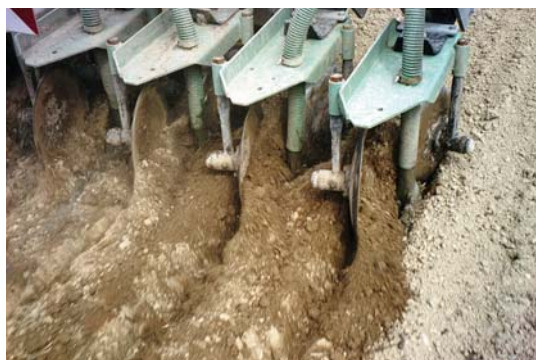
Správné zapravení: kejda vytéká z hadic aplikátoru do brázd, které se ihned zaklopí.