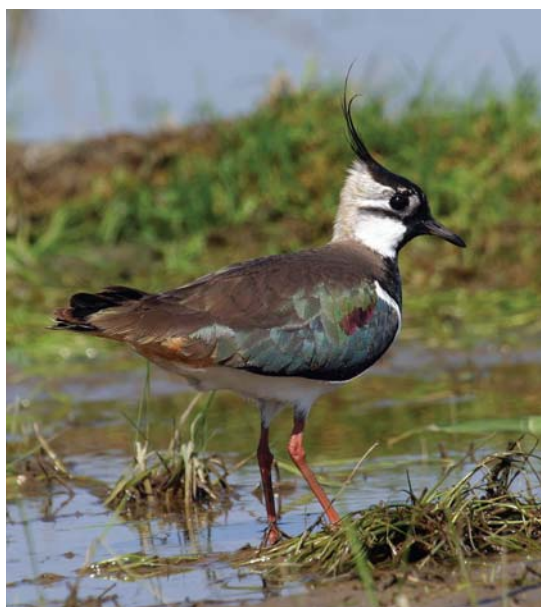
čejka chocholátá, autor Dušan Boucný

Důvod: Mnoho ptačích druhů je svou existencí vázáno na okolí vodních toků a údolní nivy. Břehy a břehové porosty dřevin či mokřadní vegetace představují pro řadu druhů vhodné místo pro hnízdění, zdroj potravy, úkryt i odpočinek. Prostřednictvím ochrany významných krajinných prvků vodní tok a údolní niva je chráněno také ptactvo.