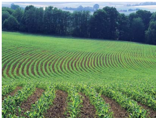
nevhodné využití svažitého pozemku (pěstování kukuřice)