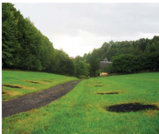
pálení sena ve shrabaných kupkách