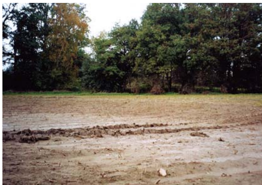
zamokřená půda nevhodná pro použití kalů

Porovná záznamy v evidenci o hnojivech, pomocných látkách, upravených kalech a sedimentech se skutečně přijatým množstvím kalů (ověřením dodacích listů apod.). Následně ověří výpočet dávky sušiny kalů použitých na 1 ha zemědělské půdy, přičemž porovná celkové dodané množství kalů s plochou, na níž byly použity. V souvislosti s tím bude kontrolní orgán vyžadovat předložení evidenčního listu využití kalů v zemědělství. Dodržování požadavku lze ověřit fyzickou kontrolou na místě.