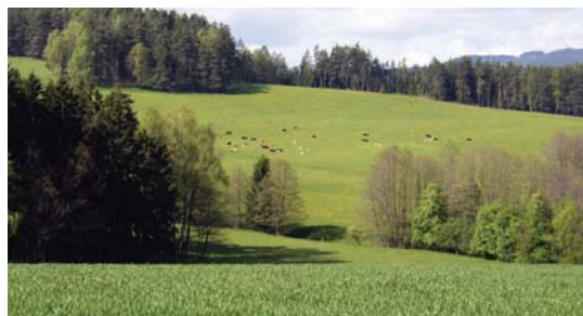
Správně organizovaná pastva s nízkou koncentrací hospodářských zvířat na travních porostech nenarušených orbou.