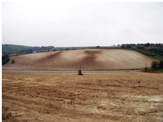
Scelení pozemků do velkých celků a rušení krajinných prvků vyvolává zrychlenou erozi půdy.