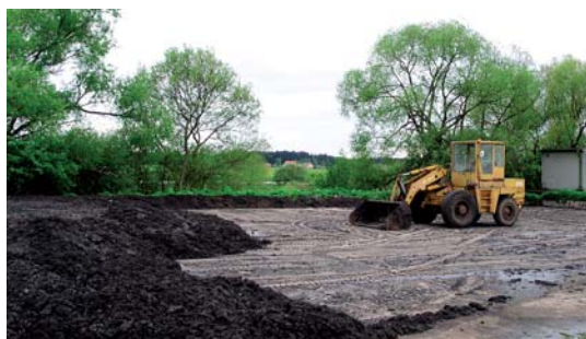
manipulace s kalu na nepropustném dvoře