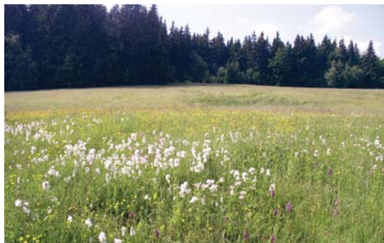
Cenným typem stanoviště je např. podmáčená druhově bohatá louka.

Hodnocení: Rozsah i závažnost zjištěného porušení jsou velké, neboť došlo k pravděpodobnému zničení předmětu ochrany. Porušení je trvalé. Inspektor zároveň nahlásí porušení (rozorání) příslušné kontrolní organizaci.