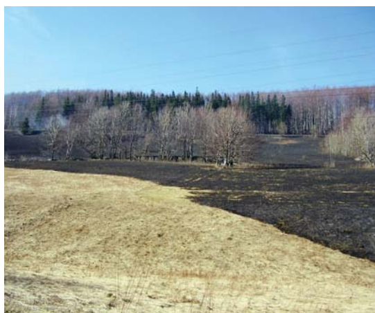
požár louky, autor Jan Ondryáš

na celé ploše. Nejzávažnější je plošné vypalování travních porostů, a to i v trvalých kulturách (sady, vinice). Pálení staré chmelové natě, větví či ostříhaných výhonů révy vinné není porušením GAEC.