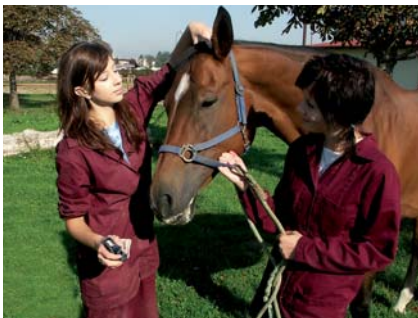
Moderně pojata odborná praxe

Přizpůsobujeme se požadavkům našich žáků, praxe a moderním trendům (další zvyšování kvalifikace, nejmodernější pracoviště v oboru, množství ICT ve výuce, čelní umístění v soutěžích v ČR, spolupráce s moderními a renomovanými firmami v oboru, bankami, výzkumnými pracovišti)