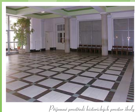
Příjemné prostředí historických prostor školy