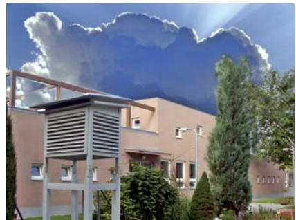
Nabízíme výuku v nadstandardních prostorách

Po ukončení oboru je možné navázat na další studium na VOŠ v naší škole v programu „Regionální politika zemědělství a venkova“.