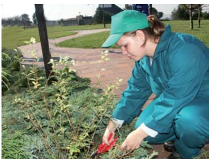
Projektování, údržby, realizace zahrad, parků