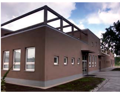
Výuka v nových prostorách

Přizpůsobujeme se požadavkům našich žáků, praxe a moderním trendům (další zvyšování kvalifikace)