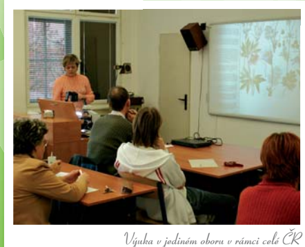
Výuka v jediném oboru v rámci celé ČR