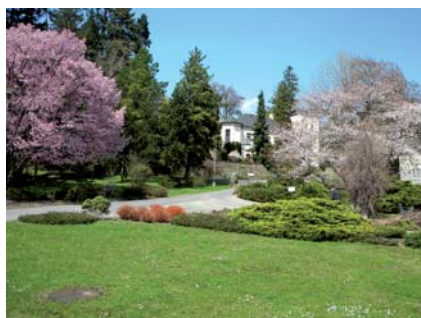
Spolupráce s Arboretum v Novém Dvoře u Opavy