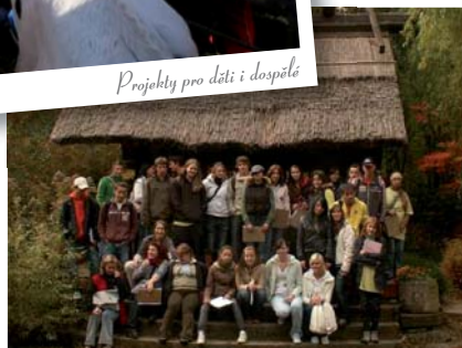
Mezinárodní výměny, exkurze, praxe