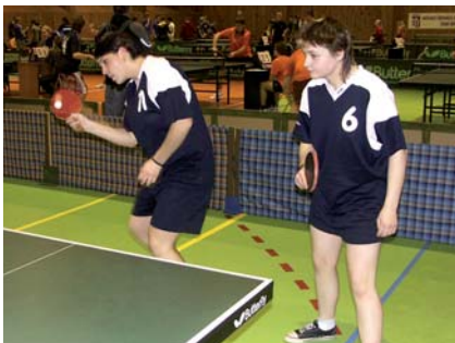
Bohatý výběr sportovních kroužků