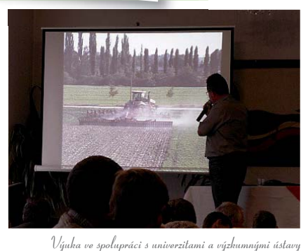
Výuka ve spolupráci s univerzitami a výzkumnými ústavů

Jsmo trenérskou školou Mendelovy univerzity v Brně, spolupracujeme se Slezskou univerzitou v Opavě.