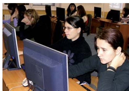
Velké zapojení ICT do výuky, k dispozici 120 počítačů a speciální programy