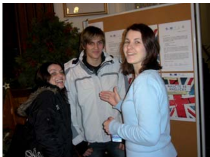
Moderní výuka se zapojením evropských projektů