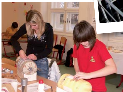
Velké množství projektů pro žáky školy