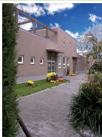
Budova nové haly