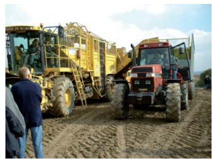
Účast na prohlídkách, soutěžích