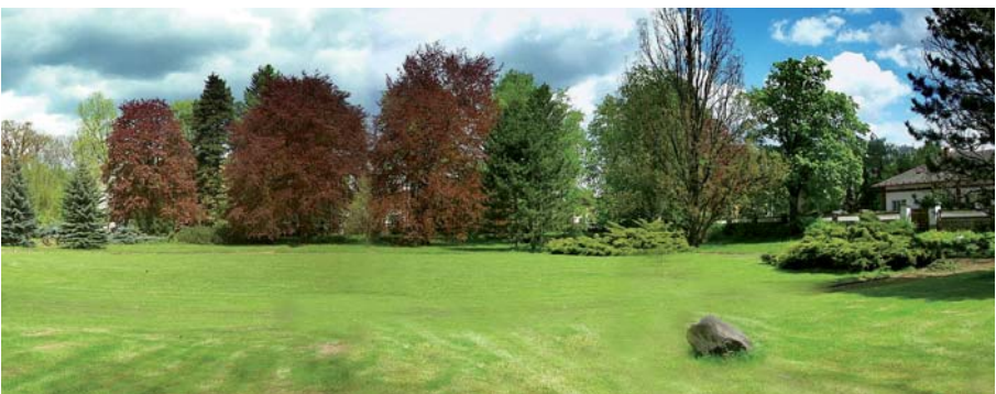
Krásné prostředí parku u školy školy

DALŠÍ STUDIUM NA VOŠ NA NAŠÍ ŠKOLE - po úspěšném absolvování čtyřletého studia nabízíme možnost pokračovat na naší škole ve studiu v rámci tříletého studia VOŠ, které je zakončeno absolutoriem a získáním titulu DiS.