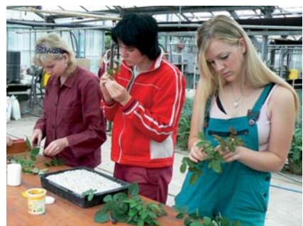
Odborná výuka na pracovištích školy i ??? podniků

MATURITA NA NAŠÍ ŠKOLE - po úspěšném absolvování studia nabízíme možnost pokračovat na naší škole ve studiu v rámci dvouletého nástavbového studia oboru Podnikání, které je zakončeno maturitní zkouškou.