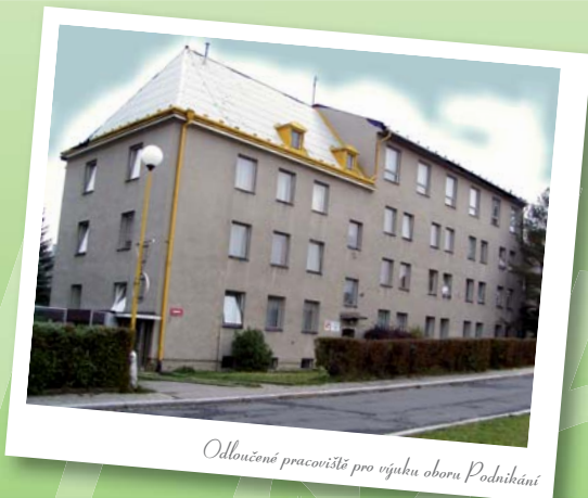
Odloučené pracoviště pro výuku oboru Podnikání