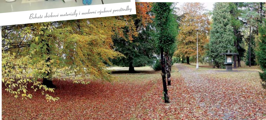
Příjemné prostředí parku u školy školy

Jedná se o alternativu ke gymnaziálnímu studiu pro žáky, kteří chtějí pokračovat ve studiu na univerzitách a vysokých školách, mají rádi přírodovědné předměty a chtějí studovat na krásné, výborně vybavené škole, jež má s uvedeným oborem největší zkušenosti v rámci ČR.