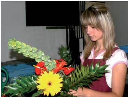
Výuka vazačství a aranžování v květinových síních