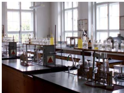
Vlastní laboratoř i velmi moderní zázemí pro praktickou výuku přímo v podnicích