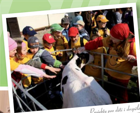
Projekty pro děti i dospělé