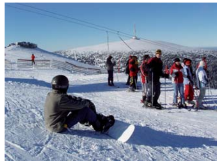
Lyžařské a sportovní kurzy