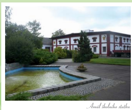
Areál školního statku