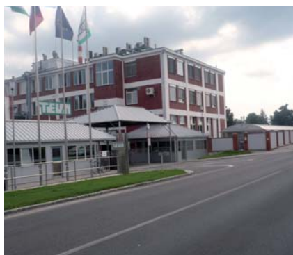
Spolupráce s významnými firmami a zaměstnavateli

Perspektivní zaměstnání v moderních provozech i možnost pokračování ve studiu na univerzitách a VŠ v oboru.