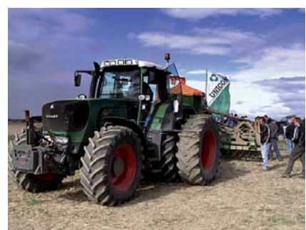
Praxe na moderní technici

MATURITA NA NAŠÍ ŠKOLE - po úspěšném absolvování tříletého studia nabízíme možnost pokračovat na naší škole ve studiu v rámci dvouletého nástavbového studia oboru Podnikání, které je zakončeno maturitní zkouškou.