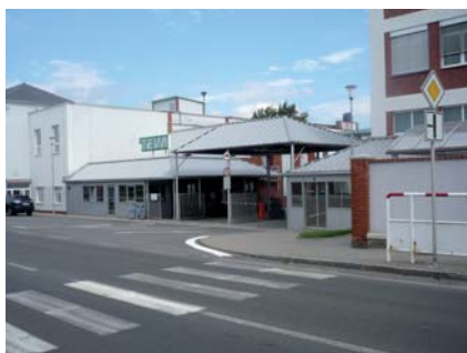
Výuka oboru Chemik-operátor ve společnosti TEVA