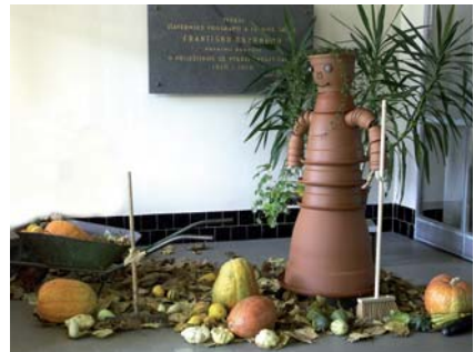
Školní výstavy pro širokou veřejnost v nově vystavěných prostorách pro praxi.