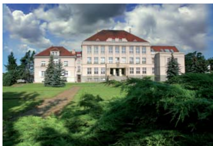
Pohled na hlavní budovu