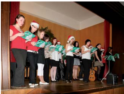
Kulturní vystoupení žáků školy

V řadě oborů žáci získávají řidičské průkazy skupiny B, C, T, svářečský průkaz, průkaz obsluhy manipulačních vozíků, obsluhy sklízecí mlátičky, práce s motorovou pilou a křovinořezem.