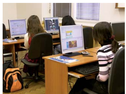
Nadstandardní vybavení ICT