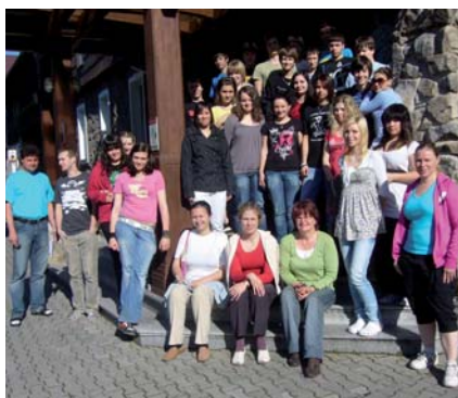
Výuka odborné angličtiny v intenzivních kurzech