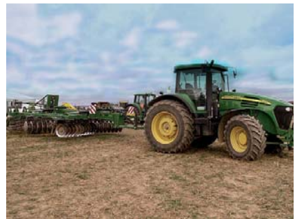
Zahraniční praxe a práce s technikou