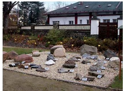
Expozice výuky ve školním parku