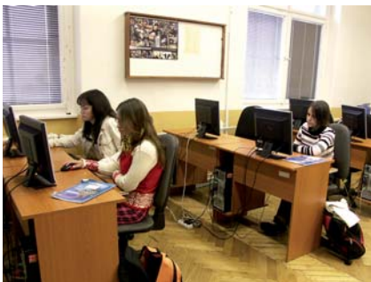
Výuka na nadstandardně vybavených pracovištích