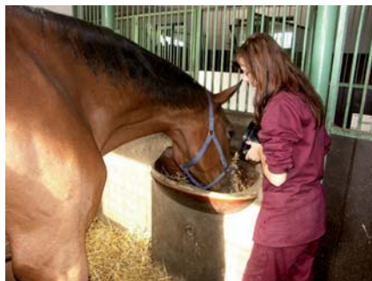
Bohatá spolupráce se zemědělskými podniky