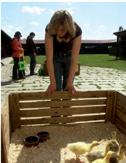
Oslovení zájemců o studium - Akce školy pro veřejnost

Tříleté pomaturitní studium zakončené absolutoriem a získáním titulu DiS. Moderně koncipovaný obor dle požadavků Evropské unie.