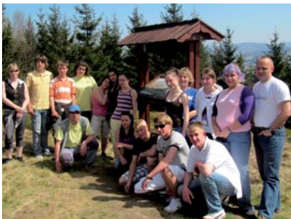
Projekty a mezinárodní výměny s evropskými partnery

Jsmo trenérskou školou Mendelovy univerzity v Brně.