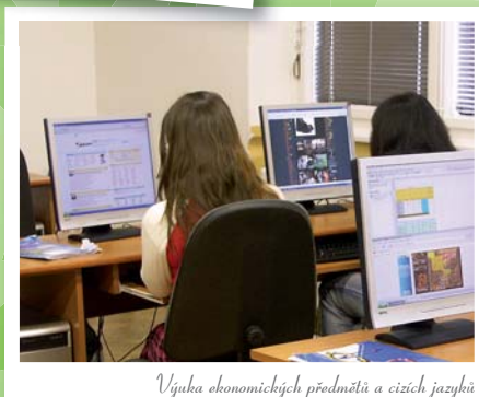
Výuka ekonomických předmětů a cizích jazyků

DALŠÍ STUDIUM NA VOŠ NA NAŠÍ ŠKOLE - po úspěšném absolvování dvouletého studia nabízíme možnost pokračovat na naší škole ve studiu v rámci tříletého studia VOŠ Regionální politika zemědělství a venkova, které je zakončeno absolutoriím a získáním titulu DiS.