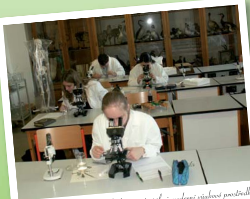
Bohaté sbírkové materiály i moderní výukové prostředky