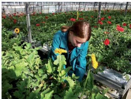
Praxe v zahradnických podnicích v Opavě a okolí

Škola je členem Asociace škol pro rozvoj venkovského prostoru, Asociace Vyšších odborných škol, Asociace učňovských zařízení, Asociace škol provozujících autoškolu, Agrární komory, Hospodářské komory, společnosti Pro Bio, ekologické společnosti M.R.K.E.V, škol Trvalé vzdělávací základny MZe ČR.