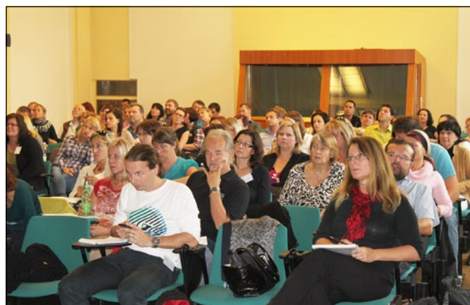
TRÉNINK MAS. Ministerstvo zemědělství a Státní zemědělský intervenční fond uspořádaly 10. září na MŽE v Praze seminář pro MAS zapojené do opatření PRV III.4.1. Ziskávání dovedností, animace a provádění a jejich partnery z tzv. „koučujících“ MAS. Řeč byla zejména o tréninkových výzvách v regionech MAS, které nerealizovaly Program rozvoje venkova LEADER.