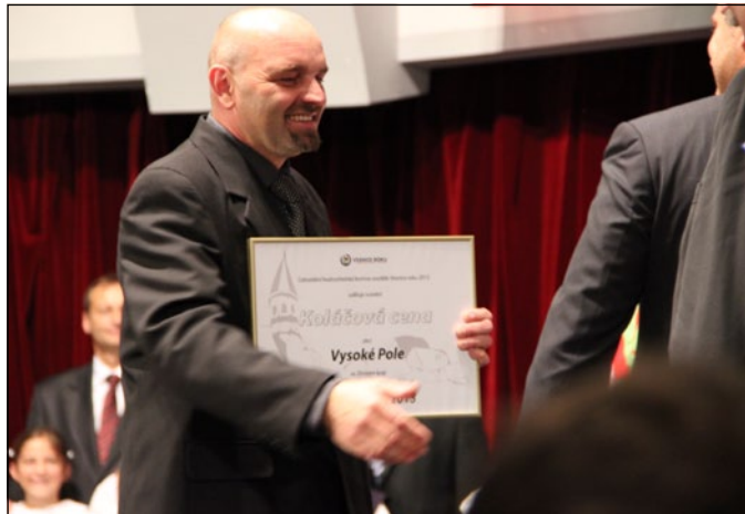
Koláčová cena pro Vysoké Pole

S využitím zdroje: www.vesniceroku.cz , www.idnes.cz Rozhovor se starostou Jeseníku nad Odrou Tomášem Machýčkem čtete na str. 9