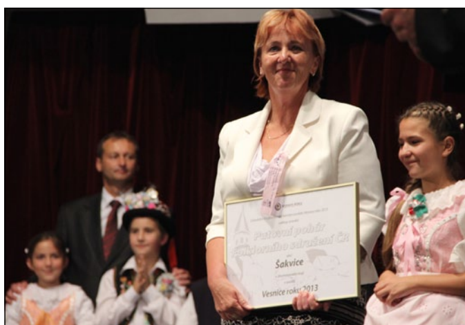
Cenu Folklorního sdružení získaly Šakvice