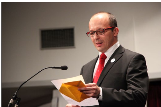
Ministr F. Lukl (MMR) vyhlásil vítěze

Jeseník nad Odrou za vítězství v obou kolech soutěže obdrží celkem dva miliony korun, druhé Holovousy 1,9 milionu korun a třetí Dolní Újezd 1,8 milionu korun. Ministr pro místní rozvoj František Lukl uvedl, že jeho předchůdce kvůli úsporám chtěl finanční odměnu snížit na polovinu. „Budeme šetřit jinde, protože prostor je,“ uvedl Lukl.