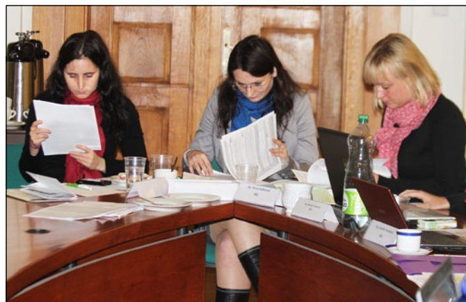
VEŘEJNÉ OBHAJOBY. V posledním zářijovém týdnu se na MŽE v Praze uskutečnily veřejné obhajoby projektů spolupráce MAS pro opatření PRV IV.2.1. V poslední výzvě tohoto opatření je téměř šedesátiprocentní převís poptávky. Rada MAS předkládala více projektů s různými partnery.