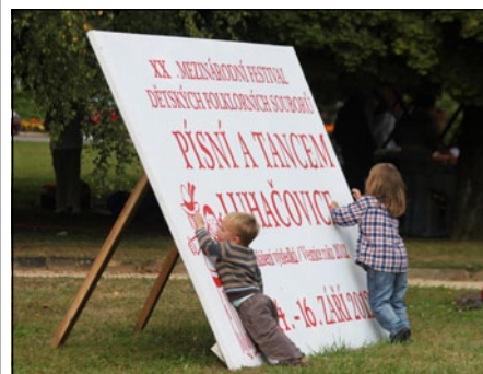
Děti u poutače na festival Písni a tancem