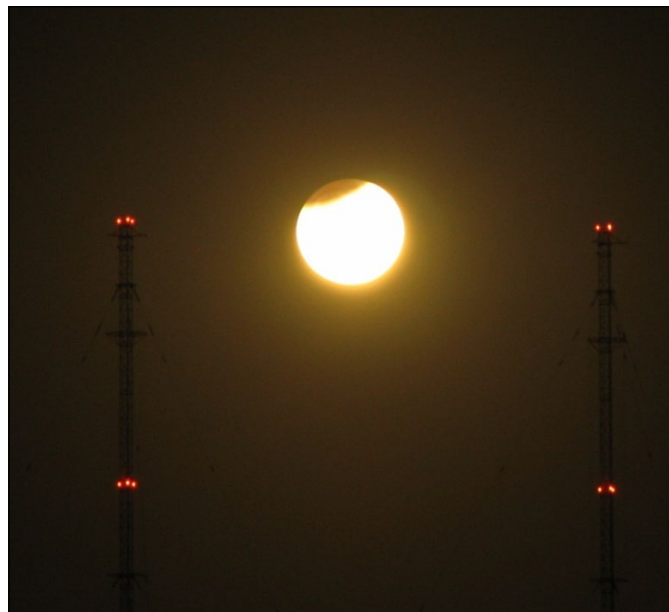
Čahouni na stráži

Pozn.: Lisabonská smlouva (2009) zavedla tzv. řádný legislativní postup v případě nařízení týkajících se politiky hospodářské, sociální a územní soudržnosti EU. Co to znamená? Evropská komise předloží návrhy nařízení Radě EU a Evropskému parlamentu, které o nich spolurozhodují. V obou institucích jsou možné až tři čtení. V případě, že nedojde ke shodě po druhém čtení a legislativa nebyla zamítnuta, dojde mezi Radou EU a Evropským parlamentem k tzv. dohodovacímu postupu. Následuje třetí čtení, v rámci kterého je dokument přijat nebo odmítnut.