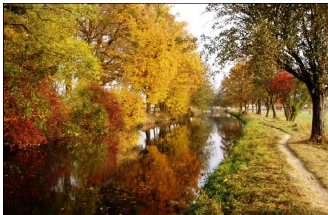
Kategorie PŘÍRODA: 3. místo – Litovel u splavu podzimní zrcadlení