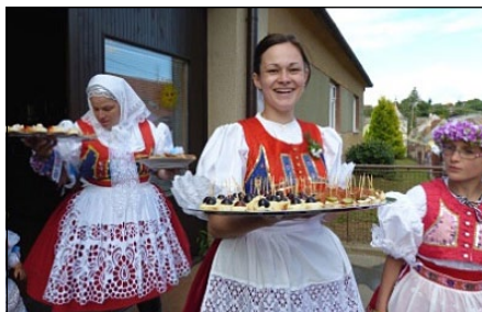
Hody v obci Rudka

„Ministerstvo zemědělství je jedním z vyhlásovatelů soutěže Vesnice roku, v rámci které udělujeme ocenění Oranžová stuha za vytváření podmínek pro plnohodnotný život