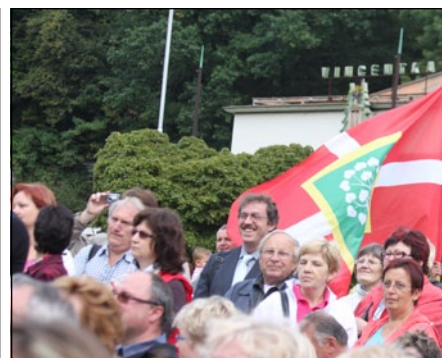
Své obce přijeli povzbudit na slavnostní vyhlášení i obyvatelé

nější. „Rozhodně patřila k mým favoritům. Ta obec žije. Na každém kroku bylo poznat, že tam mezi lidmi panuje sounáležitost. Starají se také o památky a o obecní domy, snaží se všechno udržovat a život u nich je opravdu kvalitní,“ řekl Navrátil.