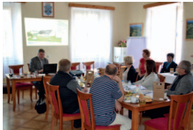
Zasedání hodnotitelské komise