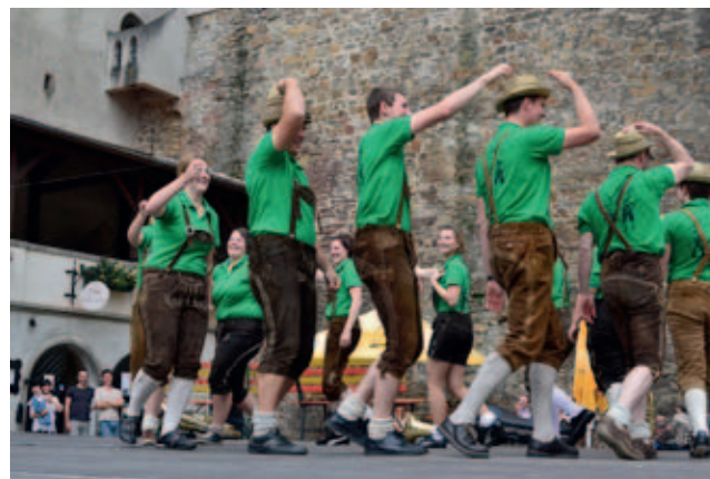
Ukázka tyrolských lidových tanců

Všichni partneři projektu, který je teprve v začátcích, chápou rozvoj venkovských regionů jako svoji prioritu. www.strakonicko.net/mas/