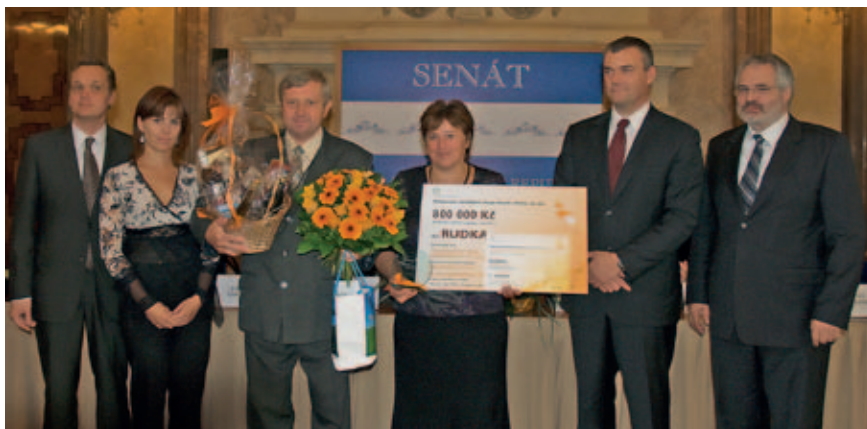
Titul „Oranžová stuha 2012 ČR“ získala obec Rudka z Jihomoravského kraje (okres Brno-venkov)

Hodnocení probíhalo v následujících oblastech: podíl místních zemědělských subjektů na zaměstnanosti obyvatel obce, péče o veřejná prostranství a kulturní krajinu, koncepční dokumenty a společné projekty, místní produkty a jejich marketing, využití netradičních zdrojů energie, nezemědělské aktivity. Neméně důležitou složkou hodnocení byl také zvolený způsob prezentace, jakým se jednotlivé obce představily. Při putování po obcích v jednotlivých krajích členové komise konstatovali, že v jednotlivých obcích je spolupráce se zemědělský-