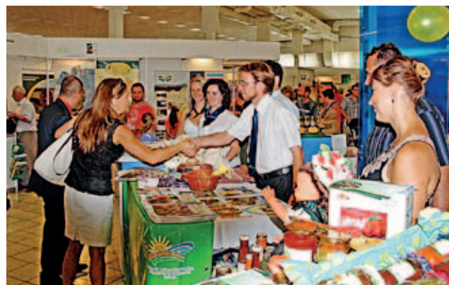
Maďarská expozice na výstavě Agrokomplex v Nitře

Stálý sekretariát (HNRN PS) , který se účastní jednání vedených pro