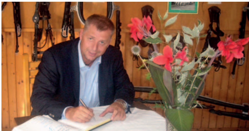
Ministr Petr Bendl navštívil na Slovensku také národní hřebčín

Na jednání byla rovněž zmíněna problematika povodní a možnosti prohloubení vzájem-