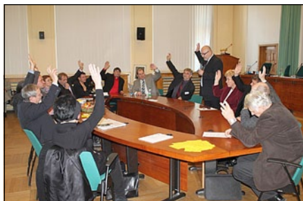
Předsednictvo právě volí předsedu SPOV