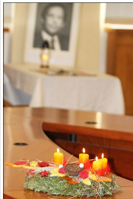
Adventní zátiší se vzpomínkou na zemřelého prezidenta Václava Havla

Podrobnější informace najdete v zápise z jednání valné hromady na www.spov.org / Informace o SPOV / Záznamy z jednání