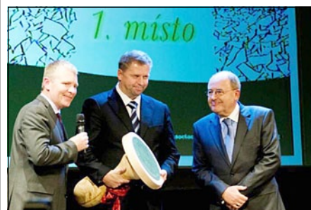
Cenu za byrokracii získalo MZE

Více informací na: http://asz.cz/redakce/index.php?clanek=58658&lang=cs&xuser=&slozka=5880