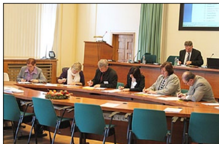
Volební komise připravuje hlasovací lístky