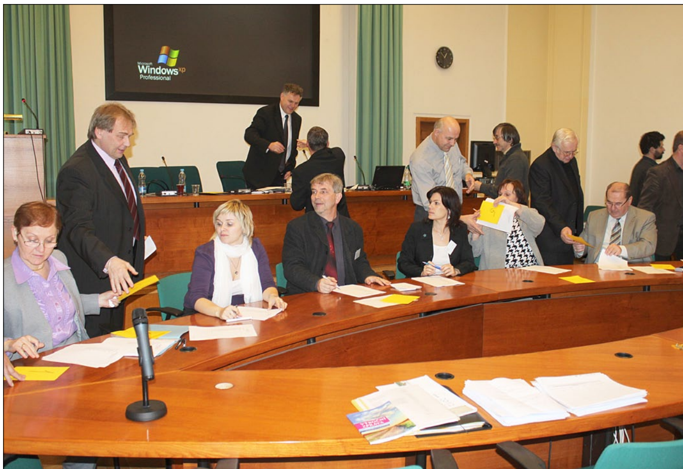
Příprava volby členů nového předsednictva SPOV ČR a rozdávání hlasovacích lístků