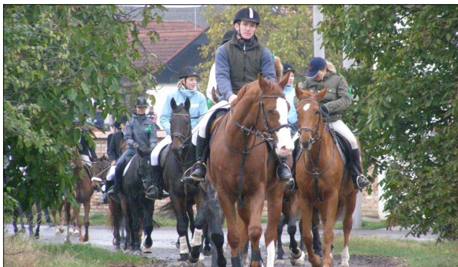
Díky programu LEADER vznikla i nová síť hipostezek

Publikované texty v rubrice Názory jsou pohledem jejich autorů. Uvítáme vaše pohledy a názory na dění na venkově.