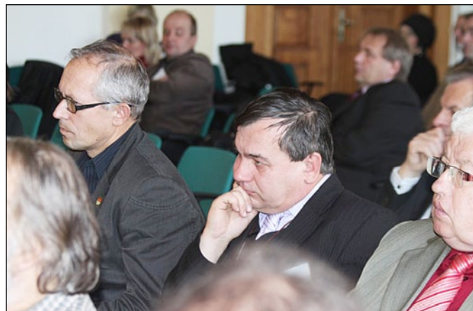
Účastníci valné hromady

tuje celá řada institucí, drobných sdružení a dalších podobných aktivit, které zajímá toto téma. Jedním z nich by mělo být i ministerstvo práce a sociálních věcí. „Chtěl bych poprosit, abychom se pokusili zmapovat všechny tyto organizace a uzavřeli s nimi dohodu o spolupráci. Pokud by to Spolek zastřešil, mělo by to větší váhu i u MPSV. Dále bychom se měli pokusit u Úřadu vlády najít pro Spolek zastoupení, abychom mohli reagovat na různé vzniklé situace," řekl Tomiczek.