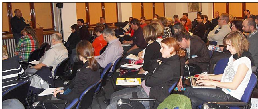
Konference farmářské trhy

Klíčovým faktorem pro úspěšnost farmářských trhů je osobnost a schopnost organizátora trhu, který dovede oslovit schopné a aktivní farmáře ve svém okolí a pozvat je na trh a současně je schopen vytvořit příjemné prostředí pro nakupující. Konference, kterou uspořádalo ve svých prostorách na pražské Letné 13. 12. 2011 Národní zemědělské muzeum, se jako historicky první jednání svého druhu u nás setkala s mimořádným zájmem. Na konferenci se sjelo na sto účastníků z celé země, kteří reprezentovali celé spektrum aktérů farmářských trhů – od samotných farmářů, přes prodejce, organizátory trhů, představitelů měst a obcí až po zástupce institucí, které ovlivňují podmínky konání trhů u nás. Nechyběla ani početná skupina vědeckých pracovníků z několika univerzit, kteří přednesli zajímavé poznatky ze svých výzkumů a zprostředkovali přítomným i cenné zahraniční zkušenosti. Na konferenci vystoupili ta-