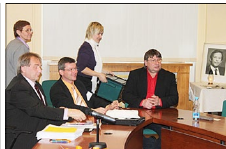
Tajná volba druhého místopředsedy