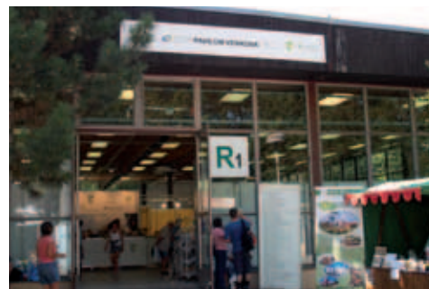
R1 - jeden z pavilonů venkova

byla letos na výstavě oproti předchozím letům opravdu silně zastoupena. Byla zde vidět celá řada expozic, které reflektují nejnovější trendy související s životem a prací na venkově a v jednotlivých regionech. Prostřednictvím Ministerstva zemědělství, Celostátní