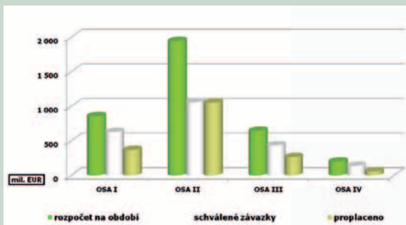
Aktuální stav implementace Programu rozvoje venkova (souhrnné informace)

Diverzifikace činností nezemědělské povahy sleduje rozvoj nezemědělských aktivit na venkově s cílem zajištění stálého příjmu obyvatelstva a vytvoření nových pracovních míst. Podpora je určena na výstavbu zařízení pro zpracování a využití obnovitelných zdrojů energie.