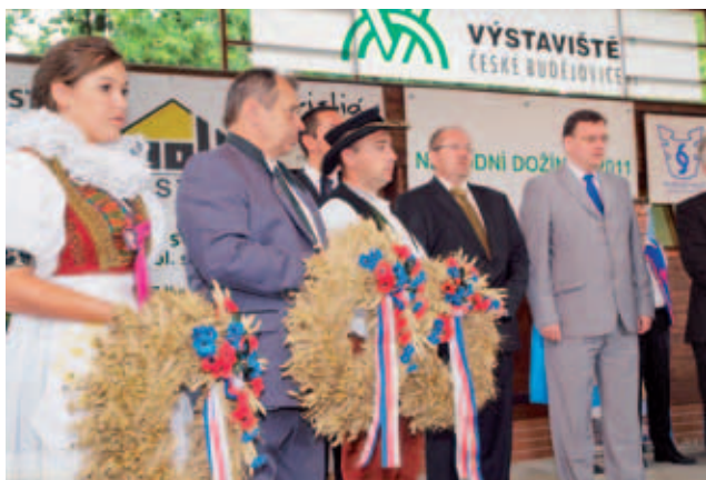
Předseda vlády Petr Nečas a ministr zemědělství Ivan Fuksa zahájili Národní dožínky