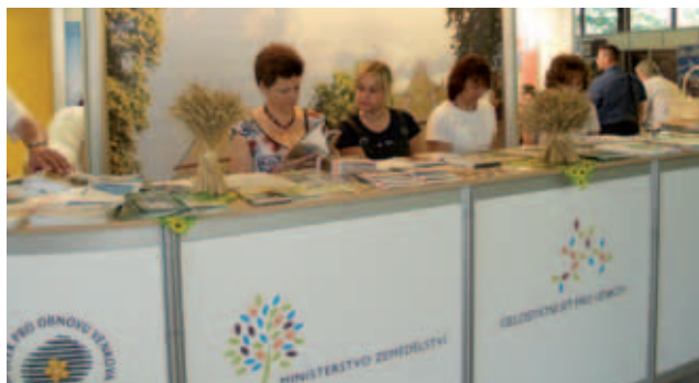
V pavilonu R3 vedle sebe byly expozice všech institucí podporujících rozvoj venkova....