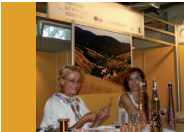
Poprvé se na letošní výstavě představili hosté ze Slovenska

sítě pro venkov a Národní síť MAS ČR, spolu se Spolkem pro obnovu venkova, se podařilo výrazně zlepšit úroveň prezentace českého venkova. Pavilony venkova R1 a R3 byly přehlídkou více než padesáti Místních akčních skupin z celé České republiky. Návštěvníci měli možnost vidět expozici Ministerstva pro místní rozvoj a bohaté zastoupení Ministerstva zemědělství. Poprvé se představila na letošní výstavě Národní síť rozvoje vidieka SR a místní akční skupiny ze Slovenska. Celý pátek, druhý den výstavy, byl ve znamení venkova, což bylo podpořeno množstvím pozoruhodných akcí v obou uvedených pavilonech i na volných plochách. Den českého venkova byl zakončen společenskou akcí „Večer venkova.“