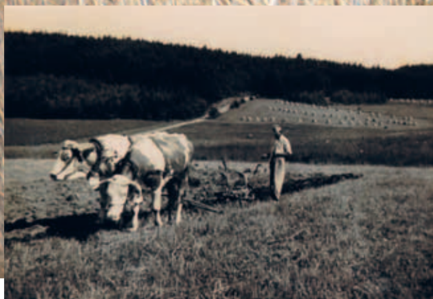
Historická fotografie Františka Uhlíka (dědečka žadatele) z třicátých let