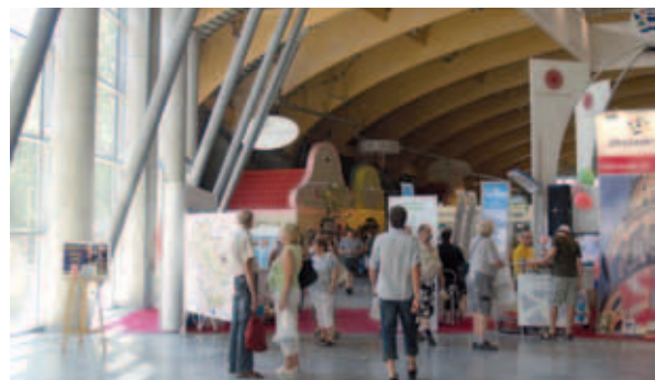
Uvnitř pavilonu T byla expozice Ministerstva zemědělství a rozsáhlá prezentace regionálních potravin ze všech krajů České republiky