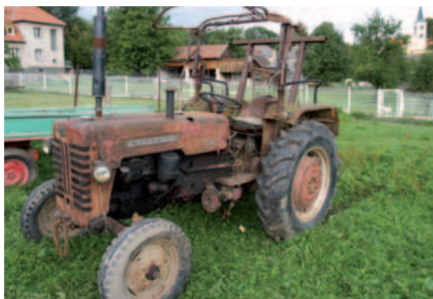
Muzeální typ traktoru, se kterým se ještě nedávno muselo pracovat....