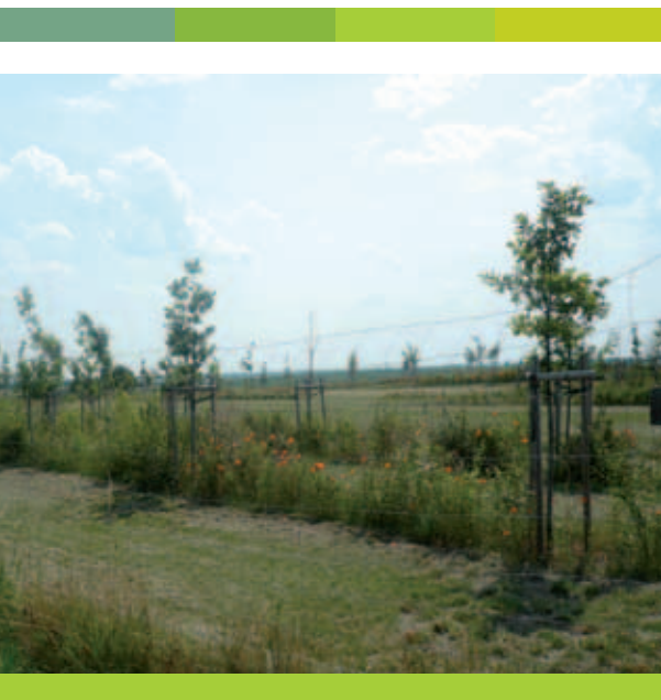
Na obrázcích vidíte detaily krajinné úpravy v k. ú. Sovenice

Již pátým rokem vyhlašuje Ministerstvo zemědělství a Ústřední pozemkový úřad ve spolupráci s Českomoravskou komorou pozemkových úprav soutěž Společné zařízení roku. Problematika pozemkových úprav patří mezi nejvíce využívaná opatření v rámci Programu rozvoje venkova.