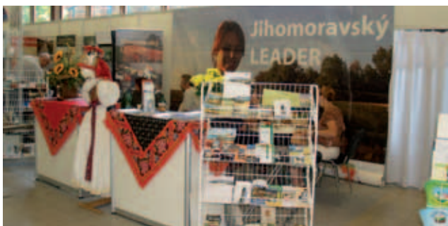
... včetně prezentací více než padesáti místních akčních skupin