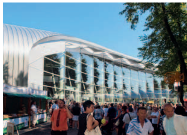
Nový pavilon T - venkovní pohled

Již 38. ročník výstavy Země živitelka s garancí Ministerstva zemědělství a Agrární komory se uskutečnil koncem srpna na výstavišti v Českých Budějovicích, které letos představilo nový multifunkční pavilon T, jemuž vévodila zejména rozsáhlá prezentace věnovaná regionálním potravinám.