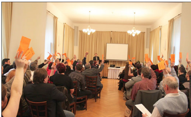
Účastníci valné hromady NS MAS