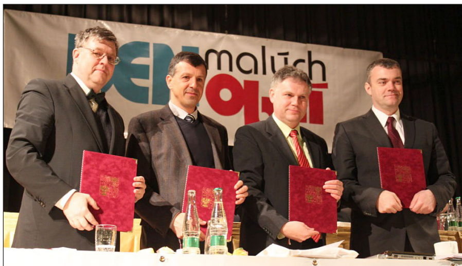
Zástupci MZe, SMO, SPOV a MMR slavnostně vyhlásili soutěž Vesnice roku 2011

Soutěže se mohou zúčastnit obce vesnického charakteru, které mají maximálně 6 300 obyvatel a které mají zpracovaný vlastní strategický dokument zabývající se rozvojem obce, program obnovy vesnice nebo program rozvoje svého územního obvodu. „Do soutěže bude zařazena obec, která v termínu do 29. dubna 2011 podá řádně vyplněnou přihlášku do soutěže. Rozhodující je razítko pošty. Přihláška do soutěže musí být vyplněna na předepsaném formuláři,“ stojí v podmínkách soutěže. Obce, které se chtějí do soutěže zapojit, musejí k přihlášce připojit také doklad o úhradě regi-