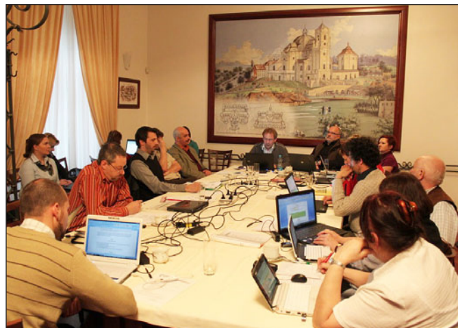
Jednání výboru NS MAS ve Křtinách, které předcházelo valné hromadě

Změna názorů, životního stylu, aby nastala obměna technologií a spotřebičů za energeticky úsporné se shodnými nebo lepšími užitnými vlastnostmi